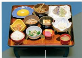
陰膳 2,160円 (税込)