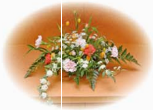
仏花 1,620円 (税込)