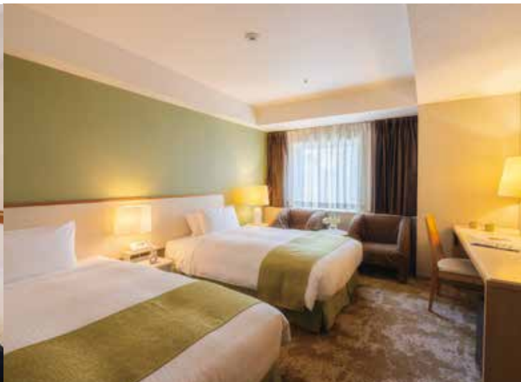
ANNEX(別館)・スタンダードツインルーム一例