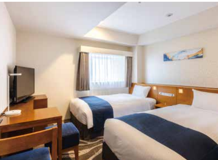
本館・スタンダードツインルーム一例