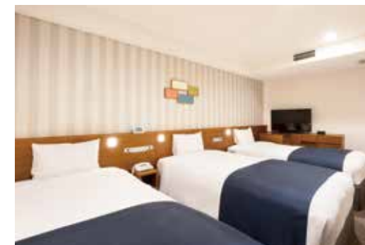
トリプルルーム Triple Room