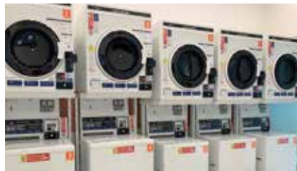
本館1階 コインランドリー [宿泊者専用]