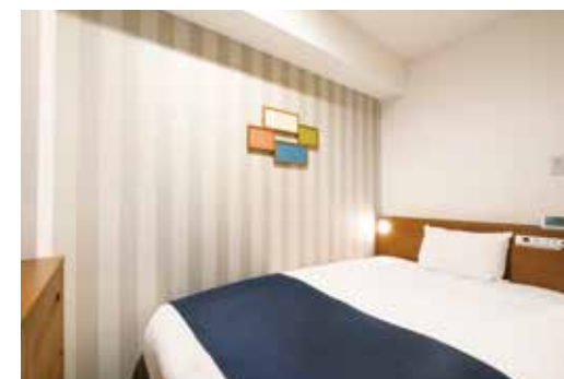
シングルルーム Single Room