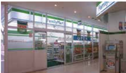
本館1階 コンビニエンスストア OPEN 7:00~23:00