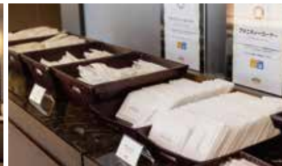
本館3階 フロントアメニティーコーナー