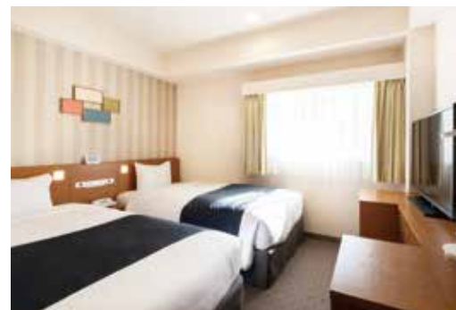
ツインルーム Twin Room