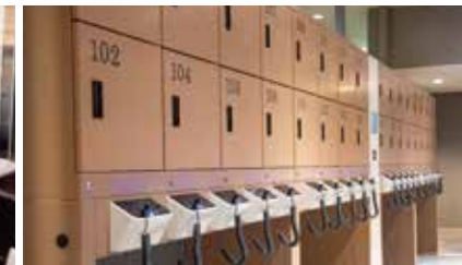
本館3階 セルフクローク [宿泊者専用]