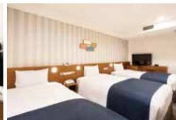
トリプルルーム Triple Room