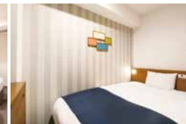
シングルルーム Single Room