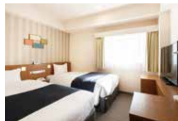
ツインルーム Twin Room