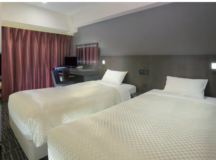
モダンツインルーム