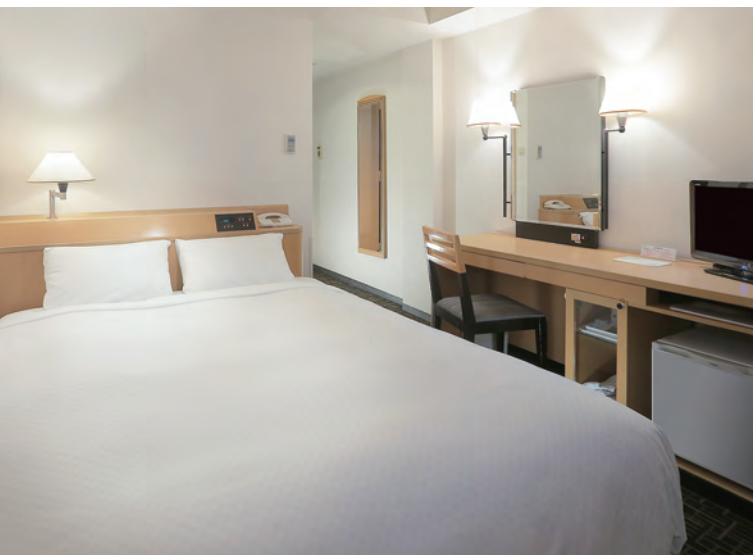
セミダブルルーム