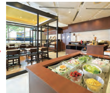
1F/ボンジュールブリュ