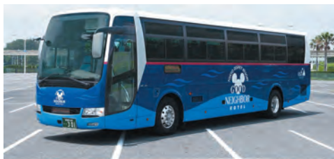
グッドネイバーホテル・シャトル (イメージ) © Disney