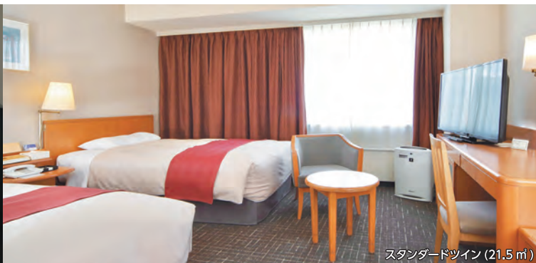
スタンダードツイン (21.5 ㎡)