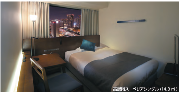
高層階スーパーリアシングル (14.3 ㎡)