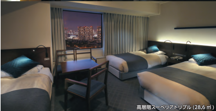
高層階スーパーリアトリプル (28.6 ㎡)