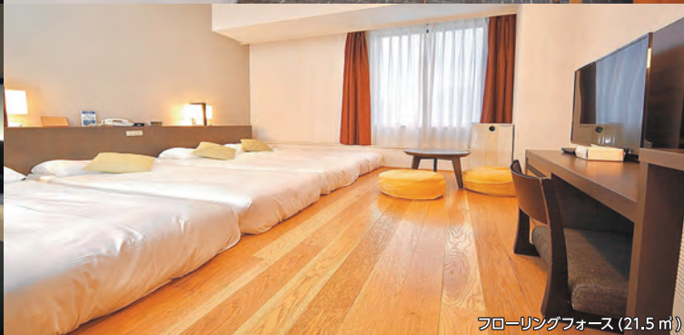
フローリングフォース (21.5 ㎡)