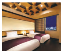
伊達政宗をモチーフにした「伊達モダン」

地元デザイナーよりデザインを募集。宮城の文化や風情を内装に取り入れた客室もご用意しております。