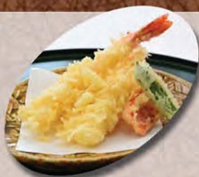
特上海老天 800円 天ぷら盛合せ 750円 にしんの田舎煮 550円