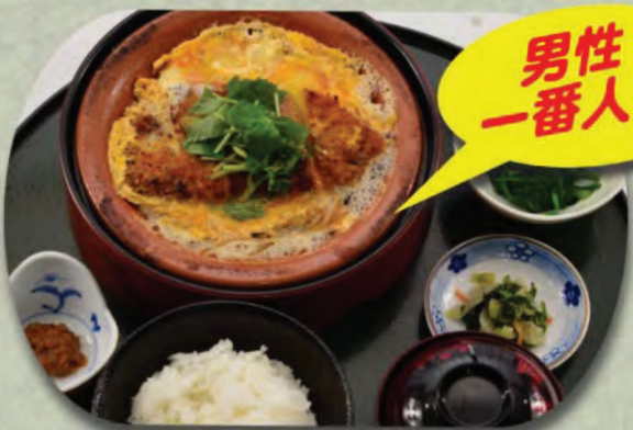
柳川風かつ煮膳 1,300円