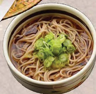
とり磯部天そば 温・冷 選べます 850円