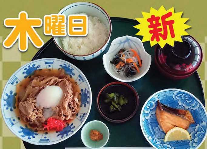
牛皿と焼き魚定食