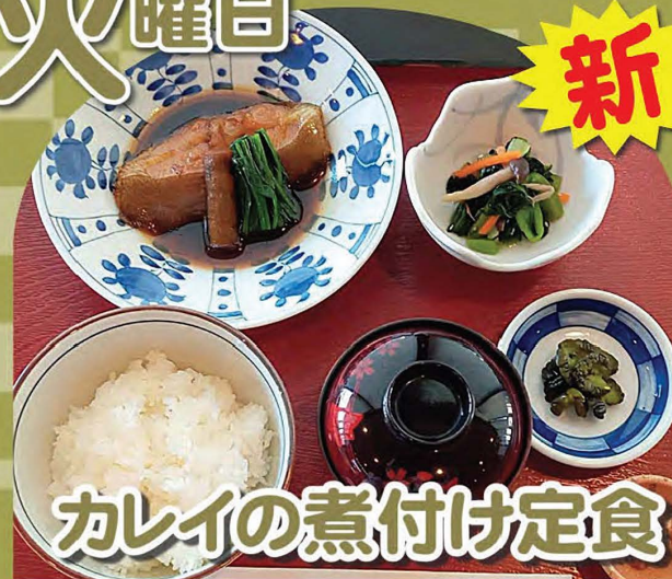
カレーの煮付け定食