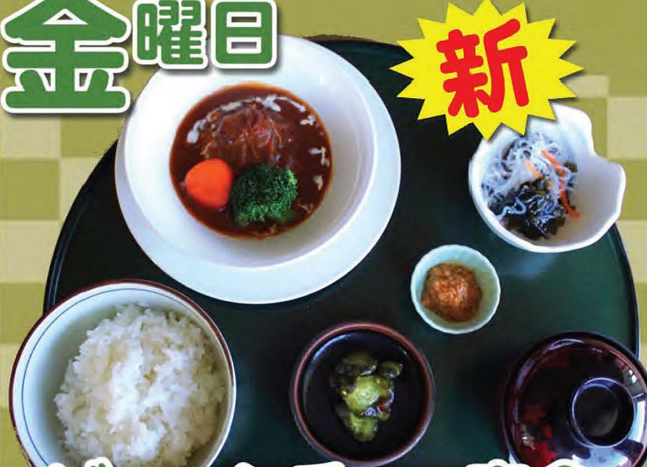
ビーフシチュー定食