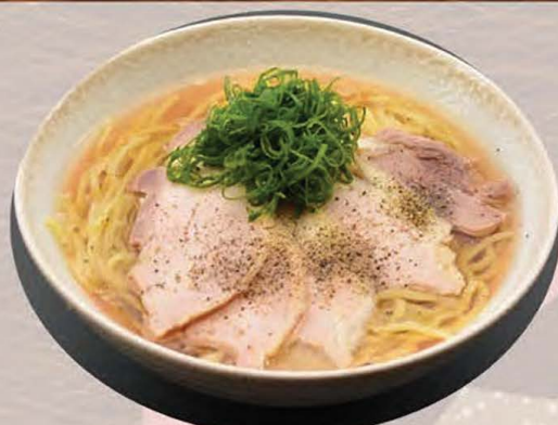
山形の冷たい肉中華 温・冷 選べます 850円