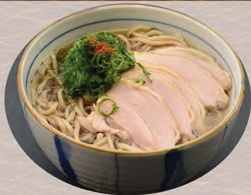
山形の冷たい肉そば 温・冷 選べます 850円