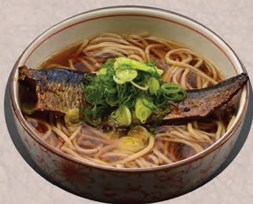
にしんそば 900円 温・冷 選べます