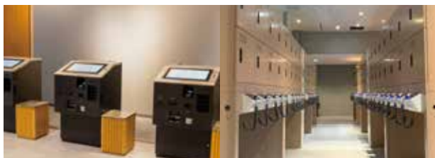
セルフチェックイン・チェックアウト機

新宿を活動拠点にしたビジネス、観光でのスマートな滞在をサポートいたします。 各種アメニティーもご用意しており、快適にお泊りいただけます。