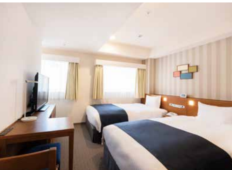
本館・ツインルーム一例