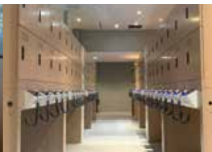
宿泊者専用セルフクローク