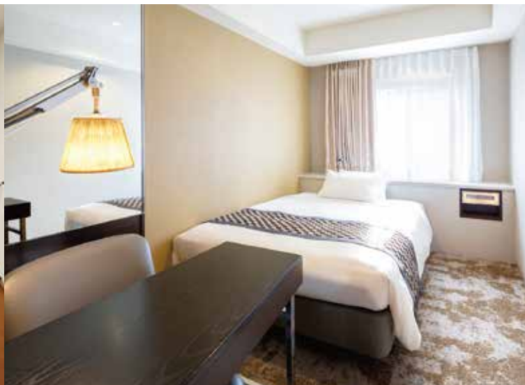
新館・スーベリアシングルルーム