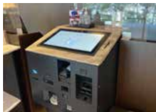
セルフチェックイン・チェックアウト機

新館3階・4階には大小8つの会議スペースを備え、パーティーやご宴会にもご利用いただけます。