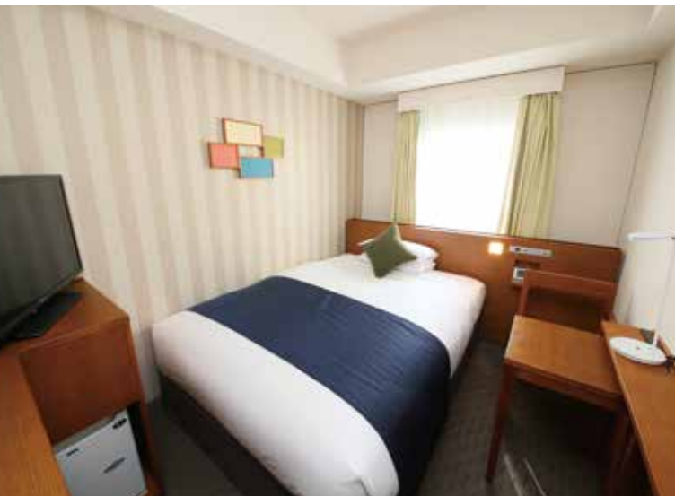
本館・シングルルーム