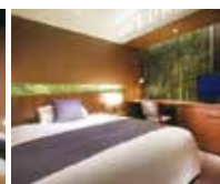
みやぎの伝統と文化を随所に採用した「けやき」