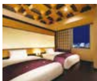
伊達政宗をモチーフにした「伊達モダン」

地元デザイナーよりデザインを募集。宮城の文化や風情を内装に取り入れた客室もご用意しております。