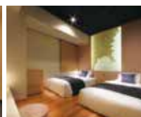
みやぎの特徴ある海岸線を再現した「リアス」