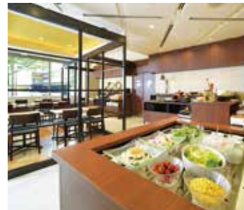
1F/ボンジュールブリュ

爽やかなお目覚めを 九州・博多の名産を 折りませたブッフェ 料理でお迎えします。